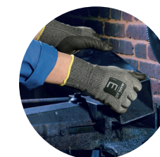
Découpe de métal