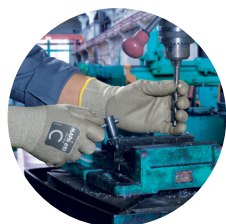
Travail en atelier mécanique