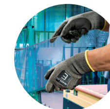
Industrie de la construction : vitrage