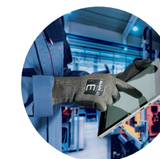
Utilisation d'écrans sur site