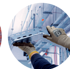
Manipulation de chemin de câble