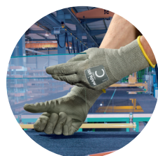
Manipulation de verre