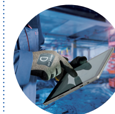
Utilisation d'écrans sur site