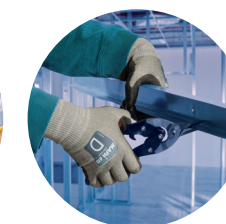
Montage de cloison